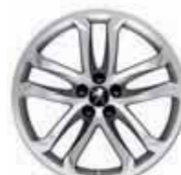
Solstice 19" Anthra hall*