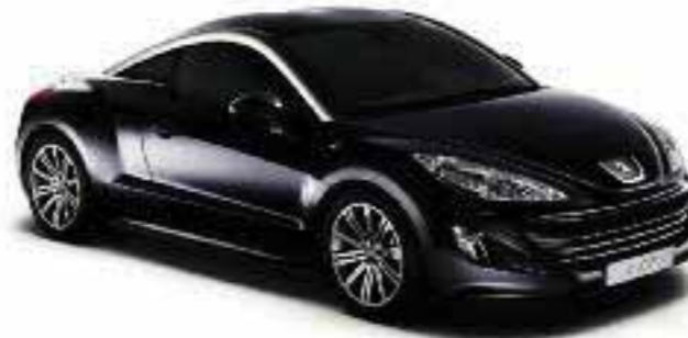
Must Perla Nera