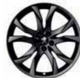
Sortilege 19" must Onyx*