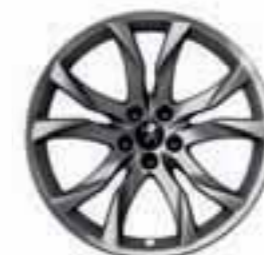
Sortilege 19" Midnight Silver hõbedane*