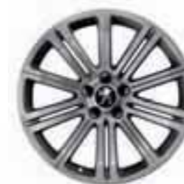
Original 18" Full Pirit hall*