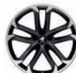
Solstice 19" must Onyx*