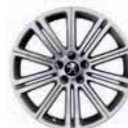
Original 18" tumehall*